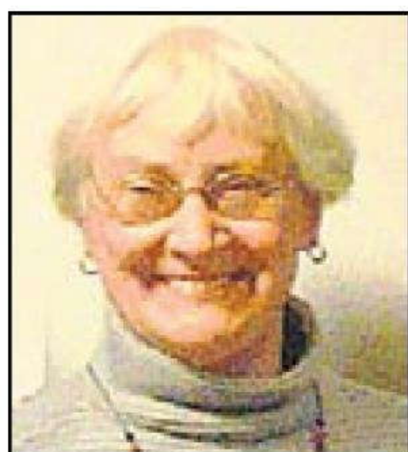
Weiß: Anita Redlich (Seniorenturnier)

Diagramm: Stellung nach dem 24. Zug von Weiß